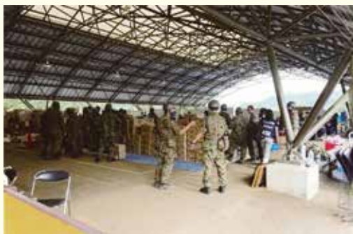
球磨村総合運動公園内