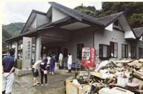
球磨村診療所の拠点化