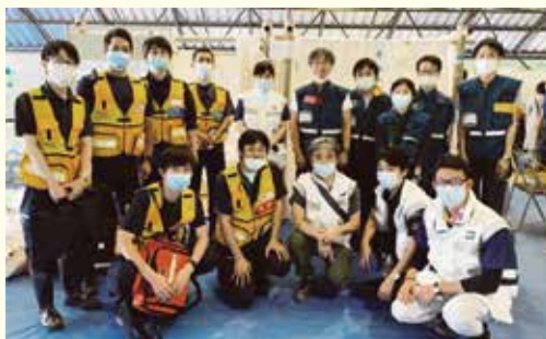
球磨村総合運動公園内SCU(広域搬送拠点臨時医療施設)・救護所の診察チーム 九州医療センター(黄)・鹿児島医療センター(白)・岩国医療センター(緑)