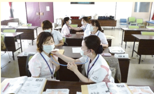
カテーテル室見学 (PCI・ABL)