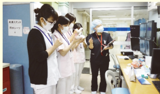
フィジカルアセスメント演習