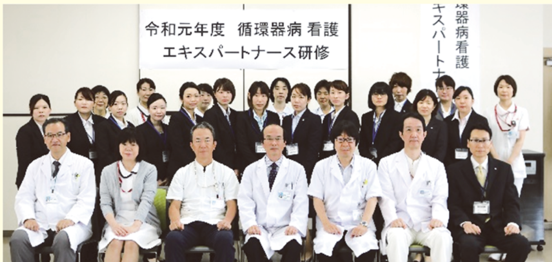
循環器病看護エキスパートナース研修 開校式